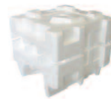
Polystyrène de calage