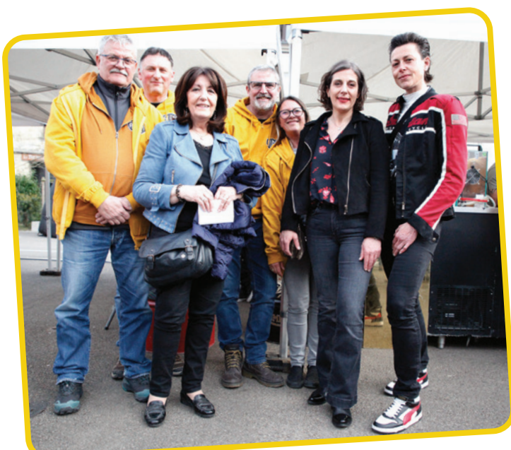
Inauguration par Mme Perdereau, Maire d'Arpajon et les Élus