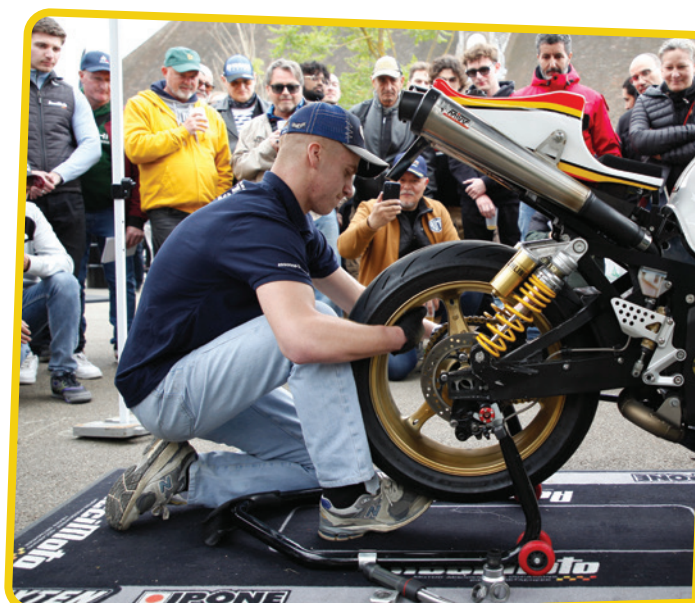
Changement de roue chronométré