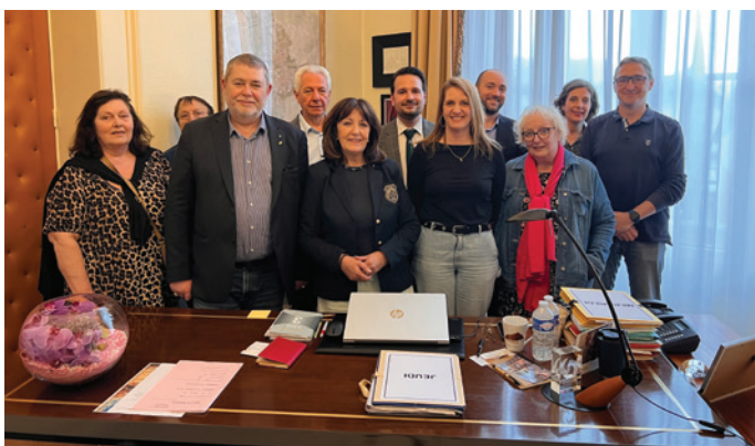
Réuni en mairie, l'exécutif municipal est pleinement mobilisé pour agir concrètement au service d'Arpajon et des Arpajonnais.

La Municipalité agit également pour le cadre de vie des Arpajonnaises et des Arpajonnais, nos écoles, la vie associative, la culture et le sport, sans oublier nos aînés.