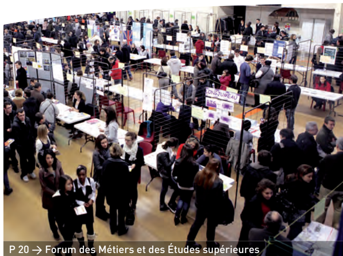
P 20 → Forum des Métiers et des Études supérieures