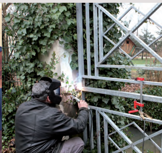
3 CENTRE DE LOISIRS PRIMAIRE installation d'un portier vidéo