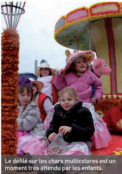
Le défilé sur les chars multicolores est un moment très attendu par les enfants.