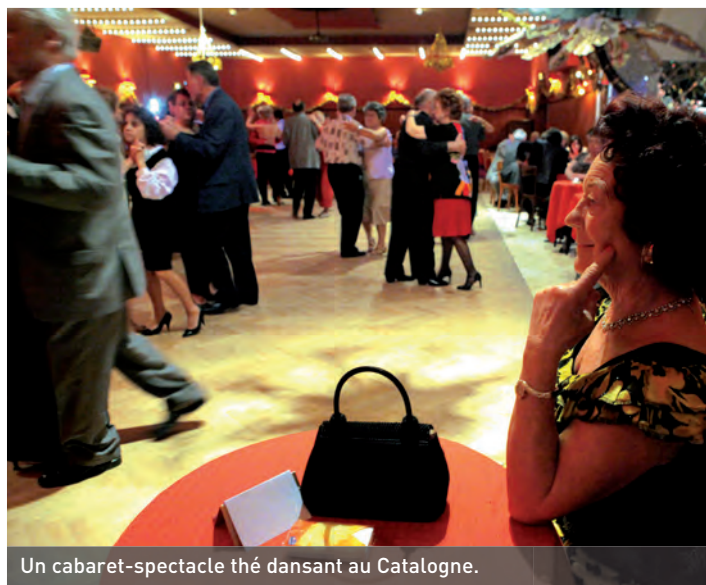
Un cabaret-spectacle thé dansant au Catalogne.

À l'échelle de la ville, ces actions permettent de créer du lien social. En participant aux sorties, spectacles et voyages,