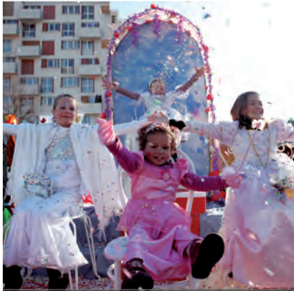
Au carnaval des enfants, les confettis ont volé !