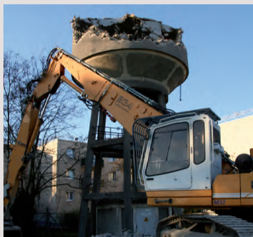
1 AVENUE DE VERDUN démolition du château d'eau