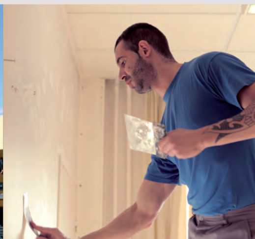
2 ECOLE VICTOR HUGO réfection des peintures (1 classe)