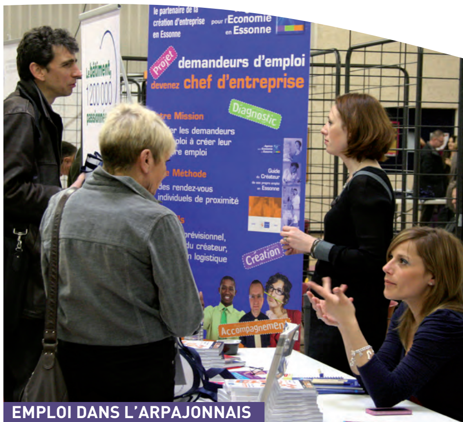
EMPLOI DANS L'ARPAJONNAIS