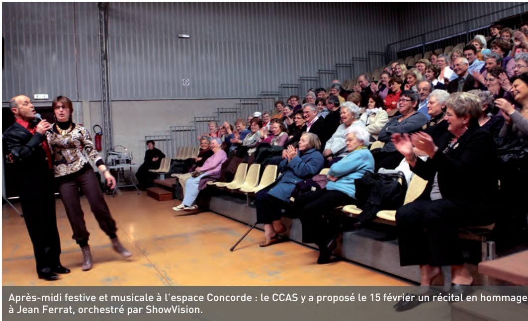
Après-midi festive et musicale à l'espace Concorde : le CCAS y a proposé le 15 février un récital en hommage à Jean Ferrat, orchestré par ShowVision.

À l'échelle de la ville, ces actions permettent de créer du lien social. En participant aux sorties, spectacles et voyages, nos aînés se rencontrent et partagent de bons moments ensemble. ”