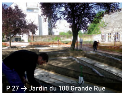
P 27 → Jardin du 100 Grande Rue