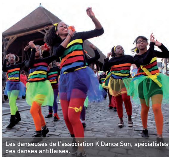
Les danseuses de l'association K Dance Sun, spécialistes des danses antillaises.