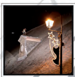
Bonne Année 2012

Samedi 14 janvier 2012 à 18h30, espace Concorde